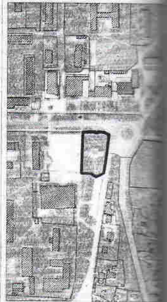
167 - numărul cadastral al terenului 01 - numărul cadastral al clădirii