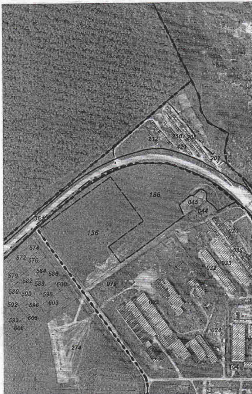
Schema de incadrare

amplasat (e) in r-nul Rezina, or. Rezina, intravilan