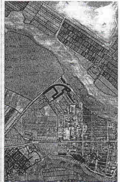
186 - numărul cadastral al terenului 01 - numărul cadastral al clădirii